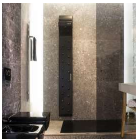
Poze ale produsului: VALIRYO®