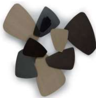
Poze ale produsului: masă ROCK

Caracteristicile tehnice ale mesei ROCK sunt: